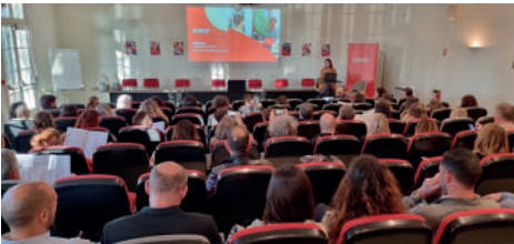
Séminaire SOLIHA pour les Agences Immobilières Sociales (AIS) à Mâcon