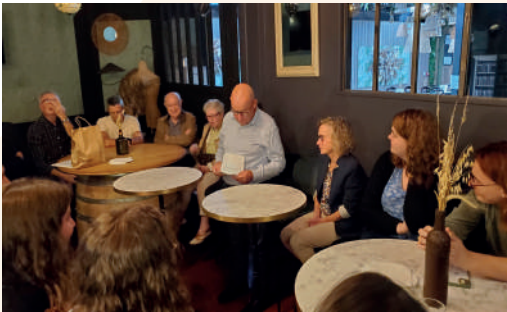
Journée d'équipe SOLIHA Cantal salariés et administrateurs