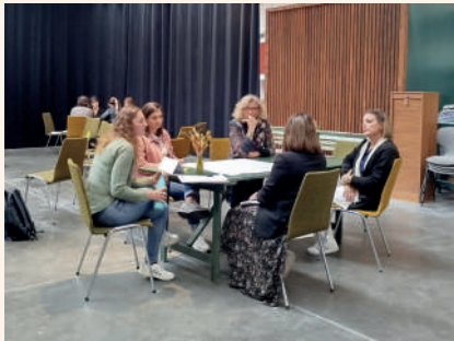
Groupe de travail Gestion locative sociale à Lyon