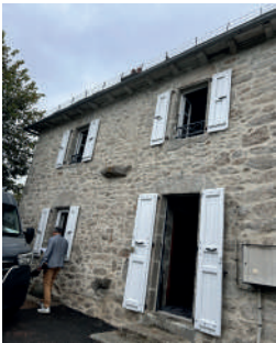
Visite officielle de fin de travaux d'un logement locatif à Saint-Mamet (OPAH 23-27 Châtaigneraie Cantalienne)