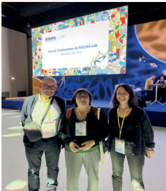
Journée nationale du Mouvement SOLIHA (Paris)