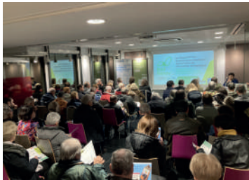
Déploiement de BAIL RENOV dans le Cantal – 2 ateliers bailleurs organisés sur la CABA avec l'ADIL 63