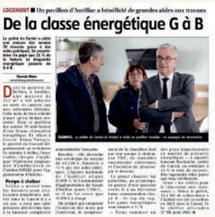
Visite du Préfet d'un logement rénové basse consommation à Aurillac