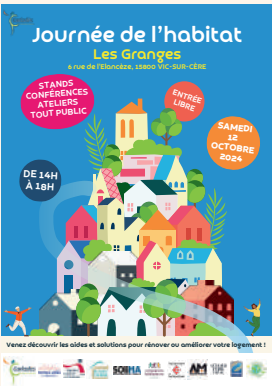
Première journée de l'Habitat à Vic-sur-Cère et animation du Truck SOLIHA