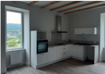
Visite de chantier bailleur à Polminhac (OPAH-RR 23-25 Cère et Goul)